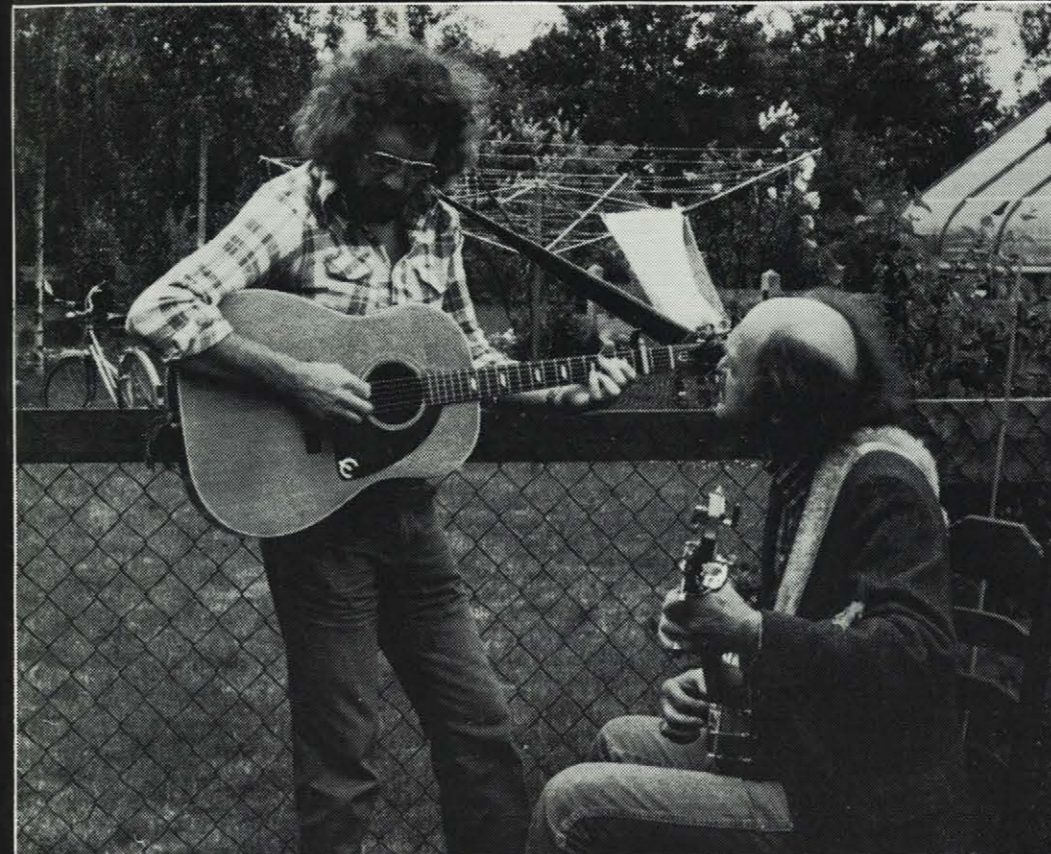
Wizz und Derroll

Bestelladresse: Stockfisch Vertrieb Sanddornweg 13 b 3300 Braunschweig